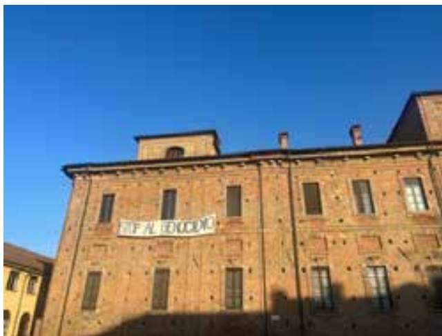
La facciata del Collegio Fratelli Cairoli a Pavia